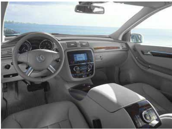
Die Verarbeitungsqualität ist zwar in Ordnung, kann aber den von Mercedesfahrzeugen der Oberklasse gewohnt hohen Standard noch nicht erreichen.