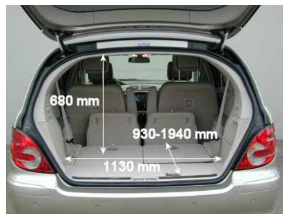
Mit 490 l Volumen ist das Kofferraumvolumen der R-Klasse standesgemäß.