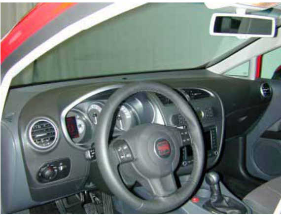
Die tadellose Verarbeitung und ausgezeichnete Funktionalität des Fahrerplatzes machen den Leon zu einer echten Empfehlung.