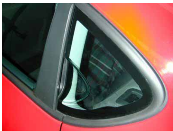
Wie beim Alfa Romeo 147 verbirgt sich der Öffner der hinteren Türen im Scheibenrahmen.