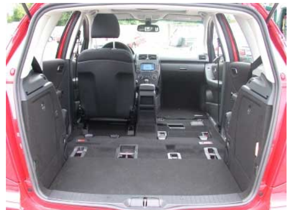
Der Kofferraum ist äußerst variabel, sogar der Beifahrersitz ist gegen Aufpreis demontierbar.