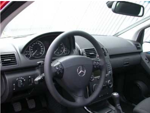
Der Fahrerplatz überzeugt durch weitgehende Funktionalität und gegenüber dem Vorgänger deutlich verbesserter Materialanmutung.