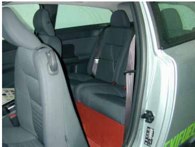
Hinten lässt es sich nur sehr beengt sitzen, vor allem die Beinfreiheit ist zu gering.

Hinten sitzen Erwachsene ziemlich beengt, weil der Abstand zu den Vordersitzen gering ist (Vordersitze für 1,85 m große Personen eingestellt).