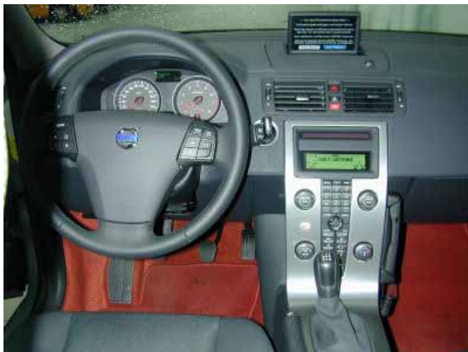
Die Bedienung des C30 ist weitgehend funktionell und einfach. Die gute Verarbeitungsqualität sowie das optische Highlight der frei stehenden Mittelkonsole kennt man bereits vom Volvo S40/V50.