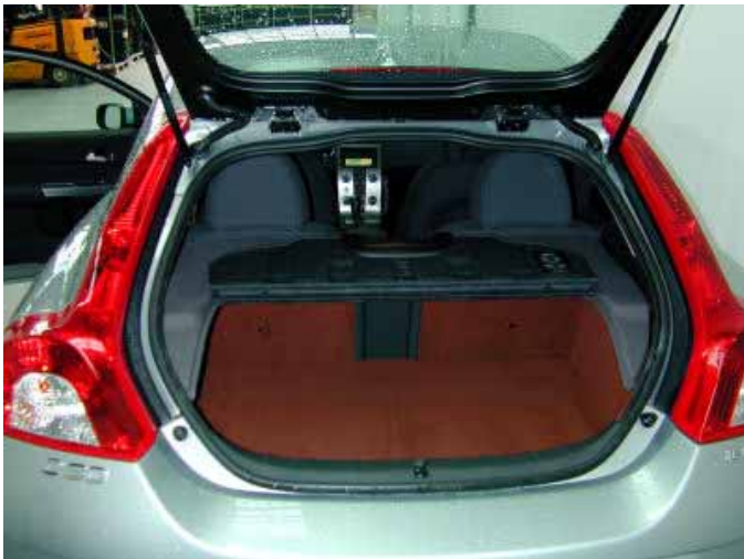
Der Kofferraum des C30 ist mit 200 l Volumen nicht von klassenüblicher Größe. Immerhin 510 l stehen bei umgeklappter Rücksitzbank zur Verfügung.