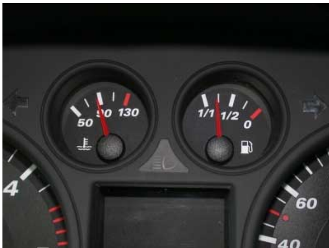
Etwas gewöhnungsbedürftig ist die Kraftstoffanzeige, üblicherweise nimmt die Skala nach rechts zu.