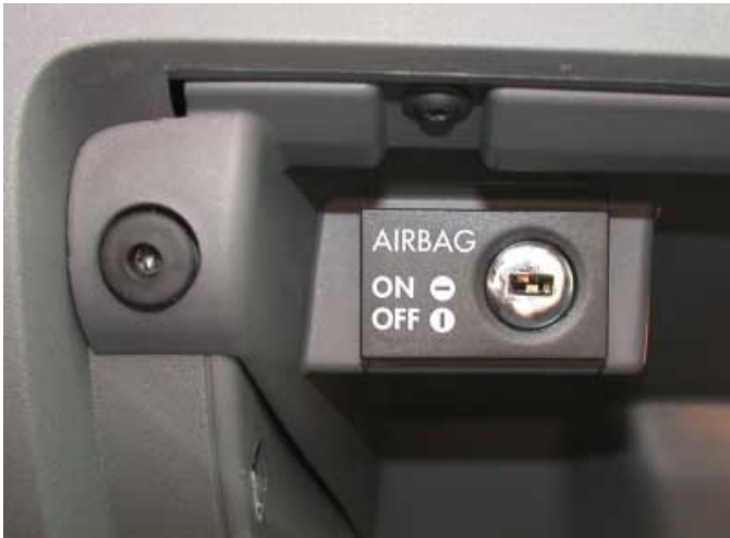
Per Zündschlüssel lassen sich die Beifahrerairbags deaktivieren. Damit können auch auf diesem Sitzplatz rückwärtsgerichtete Kinderrückhaltesysteme verwendet werden.