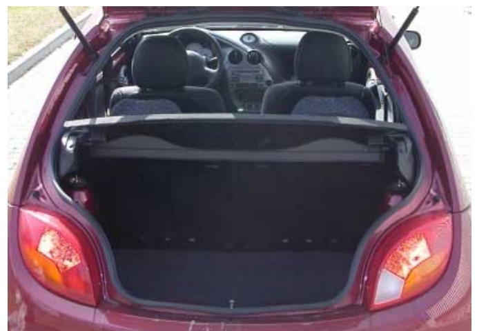
Mit 180 l Volumen ist der Kofferraum des Ka ausreichend groß.

Gemessen an der Fahrzeugklasse ist das Kofferraumvolumen mit 180 l - bei geklappten Rücksitzlehnen 440l - zufriedenstellend (gemessen bis zur Fensterunterkante).