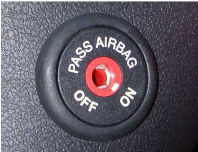
Der Beifahrerairbag lässt sich per Zündschlüssel deaktivieren. Damit können auch auf diesem Sitzplatz rückwärtsgerichtete Kinderrückhaltesysteme verwendet werden.

werden, so dass auch auf dem Beifahrersitz rückwärts gerichtete Kindersitze montiert werden dürfen.