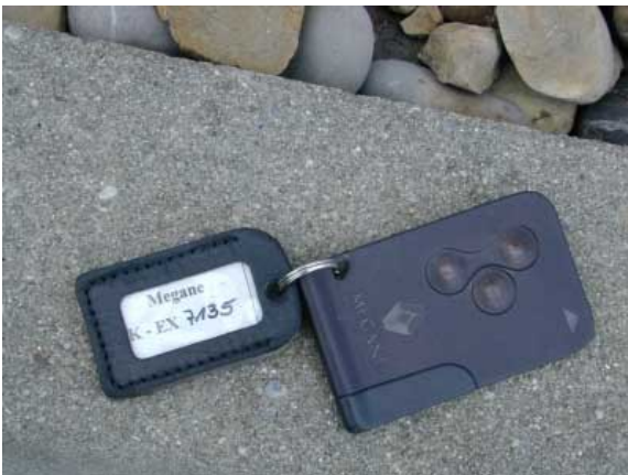
Zündschlüssel ade; der Megane startet auf Knopfdruck, nachdem die Türen per Key-Card entriegelt wurden.