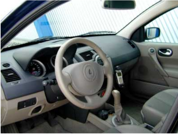
Das Armaturenbrett des neuen Renault Megane beweist, daß sich Funktionalität und außergewöhnliches Design nicht zwangsläufig ausschließen.

onen. So startet der Motor nach kurzem Knopfdruck selbsttätig, auch wenn er noch kurze Zeit zum Vorglühen benötigt, oder schaltet sich das Fahrlicht ein, wenn es gebraucht wird. Das gleiche gilt für die Front- und den Heckwischer. Alle 4 Fensterheber haben praktische Schalter mit Antippfunktion; die Außenspiegel lassen sich nicht nur elektrisch einstellen, sondern auch anklappen. Die hochwertige Audioanlage kann auch von einem praktischen Satelliten vom Lenkrad aus eingestellt werden. Es gibt Warn- und Kontrollleuchten für besonders viele Funktionen; ein Bordcomputer informiert u.a. über Momentan- und Durchschnittsverbrauch. An Ablagen besteht kein Mangel; das große Handschuhfach lässt sich kühlen.