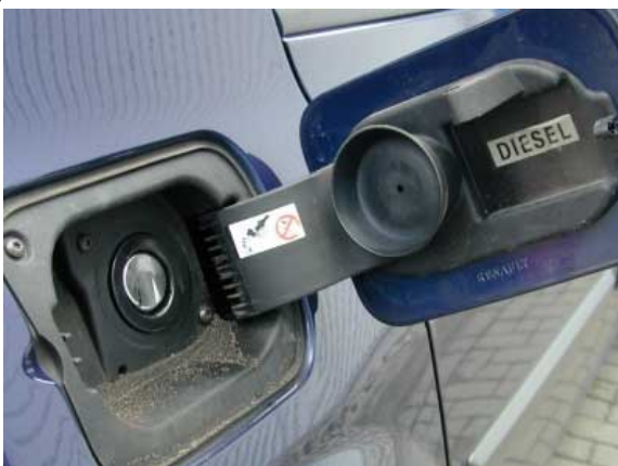
Eine einfache aber sinnvolle Lösung ist der in die Klappe integrierte Tankdeckel.