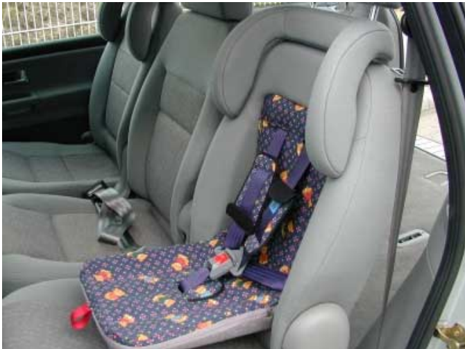
Integrierte Kindersitze sind gegen einem Aufpreis von 190 Euro erhältlich.