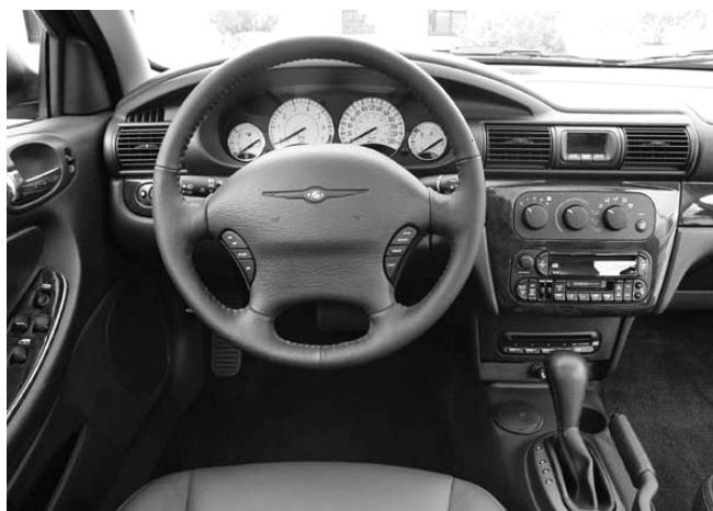
Übersichtlich und funktionell präsentiert sich das Armaturenbrett des Sebring.