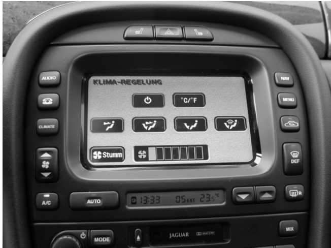
Das in der Mittelkonsole integrierte Display ist übersichtlich und einfach zu bedienen