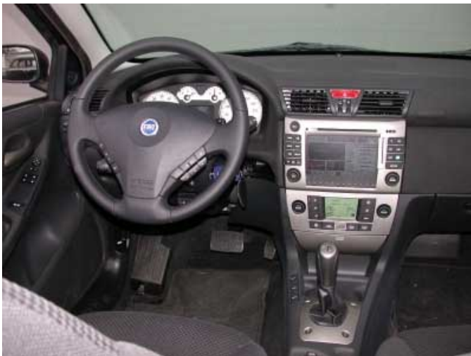
Außer den Bedienelementen für Heizung und Lüftung ist der Abarth leicht zu bedienen.