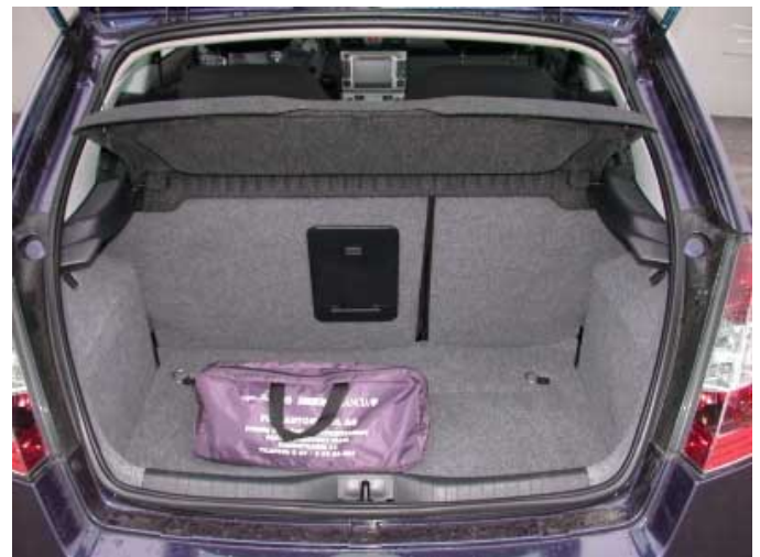
Mit 315 l Kofferraumvolumen rangiert der Stilo im Mittelfeld der Fahrzeugklasse.

Das Volumen ist mit 315 l zufriedenstellend. Wenn die Rücksitze vorgeklappt sind, fasst der Kofferraum 700 l (gemessen bis Fensterunterkante).