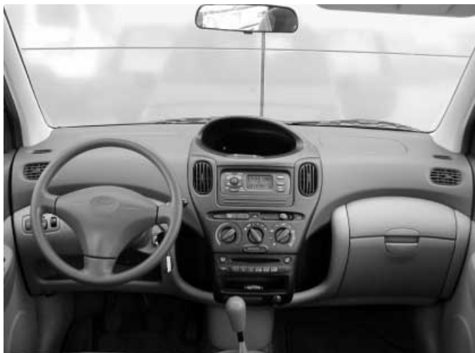
Äußerst gewöhnungsbedürftig sind die in der Mitte angeordneten Instrumente.