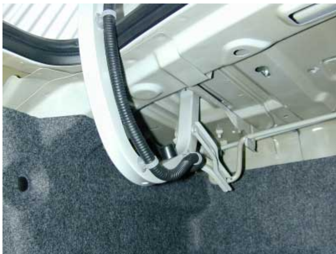
Die weit in den Kofferraum ragenden Haltebügel der Klappen-schränken das nutzbare Volumen ein.