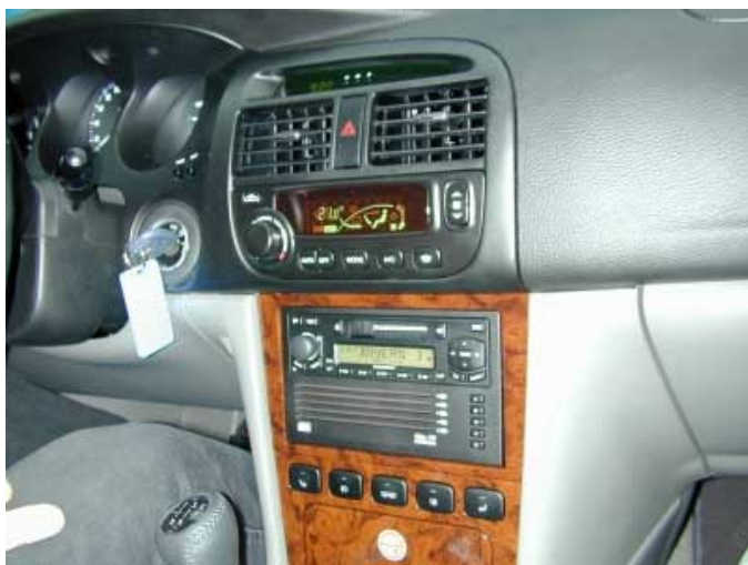
Gut ablesbare Instrumente und eine weitgehend funktionelle Bedienung prägen den Evanda. Gut: Das eigentlich zu tief positionierte Radio lässt sich auch vom Lenkrad aus bedienen.