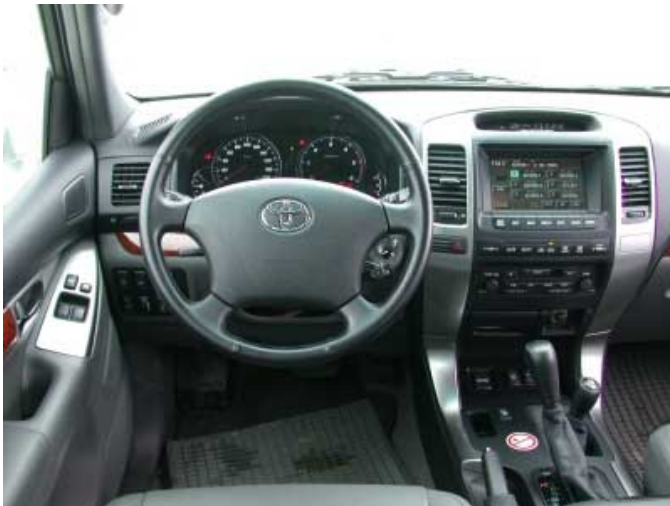
Sowohl die äußere Erscheinung als auch der Fahrerplatz erinnern nur noch wenig an den rustikalen Geländewagen früherer Tage.