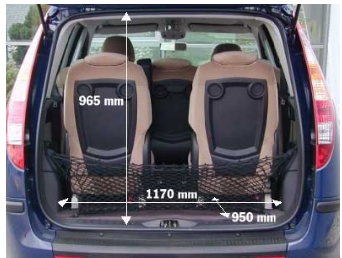
Gigantische 780l Volumen fasst der Kofferraum des Ulysse mit fünf Sitzplätzen.