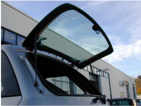
Ob hier BMW Pate gestanden hat? Auf jeden Fall erleichtert die separat zu öffnende Heckscheibe das Beladen.

Gurtbänder eingeklemmt und beschädigt werden. Weder eine Durchladeluke noch ein Skisack sind erhältlich.