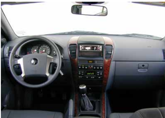
Neben der üblichen, guten Funktionalität überzeugt der Sorento durch ein gelungenes Innenraumdesign und angenehme Materialauswahl.