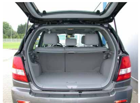
Mit 380l Volumen ist der Kofferraum nicht allzu groß.