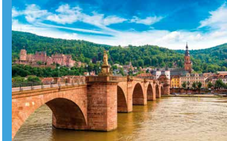
Oben: Alte Brücke und Schloss sind die Wahrzeichen von Heidelberg.