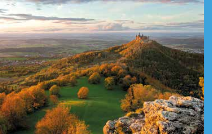
Oben: Mystisch und märchenhaft lockt die Burg Hohenzollern.