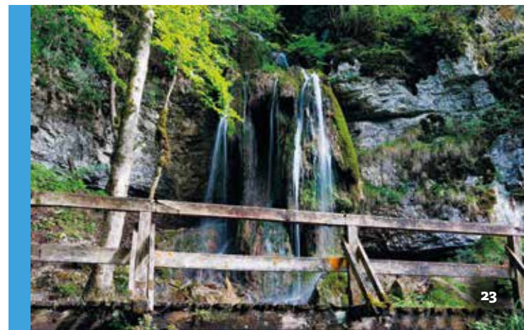
Unten: Die Wutachschlucht lädt zu eindrucksvollen Wanderungen ein.

Die wohl beliebteste und eindrucksvollste Tour durch die Schlucht ist die 13 Kilometer lange Wanderung von der Wutach- zur Schattenmühle nördlich von Bonndorf. Auf gut beschilderten Wegen geht es zwischen steilen Wald- und Felsflanken hindurch, vorbei an moosbewachsenen Steinen, am Wutachufer entlang, wo sich der Fluss tosend seinen Weg durch die Felsritzen bahnt und in rauschenden Wasserfällen die Felswände hinabstürzt. Ein überwältigendes Naturerlebnis in einer der letzten ursprünglichen Wildflusslandschaften Mitteleuropas!