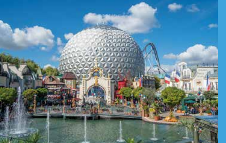
Oben: Der Europa-Park Rust begeistert mit Attraktionen zum Staunen.