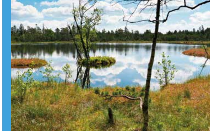
Oben: Tundra-Feeling im Hochmoorgebiet Kaltenbronn.