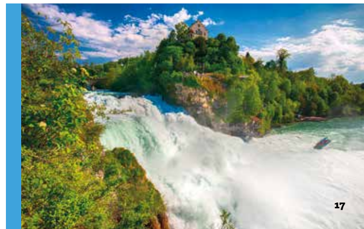
Unten: Spektakuläre Wassermassen am Rheinfall in Schaffhausen.

Herrliche Aussichtspunkte findet man um das Schlösschen Wörth auf einer Insel im Rhein und das Schloss Laufen auf der anderen Rheinseite. Teils weit über den Fluss hinausragende Plattformen am Wasserfall ermöglichen atemberaubende Blicke auf die unbändig tosenden Wassermassen. Und wer das imposante Spektakel aus einer ganz besonderen Perspektive erleben möchte, unternimmt einfach eine Rund- oder Überfahrt mit Boot oder Schiff , auf der man das gewaltig hinabstürzende Wasser aus nächster Nähe erleben kann. Besonders eindrucksvoll ist das Naturerlebnis abends, wenn der Fluss und seine Umgebung beleuchtet sind.