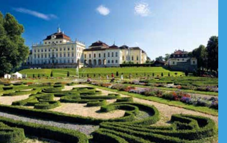
Oben: Schloss Ludwigsburg beeindruckt mit barocker Pracht.