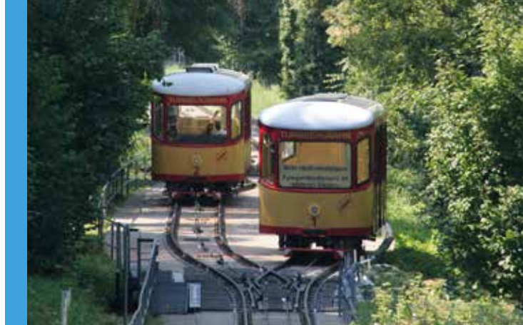
Oben: Die Karlsruher Turmbergbahn ist ein altehrwürdiges Kulturgut.