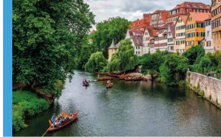
Oben: Idyllische Stocherkahnfahrt an der Neckarfront in Tübingen.

Im 19. Jahrhundert im Stil des Historismus errichtet, versprüht es inmitten seiner zauberhaften Umgebung einen ebenso ►mystischen Charme wie ihr »Highland-Pendant« und war bereits Drehort einer Märchenverfilmung. Nicht umsonst wird das erhabene alte Gemäuer am Albtrauf der Schwäbischen Alb auch als ►Märchenschloss Württembergs bezeichnet. Inspiriert von Wilhelm Hauffs Roman »Lichtenstein«, ließ Wilhelm Graf von Württemberg als romantische Huldigung ans Mittelalter die Schlossanlage auf den Grundmauern einer alten Ritterburg erbauen. Heute lassen sich Innenräume wie Waffenhalle, Schlosskapelle, Königszimmer und Rittersaal im Rahmen einer ►30-minütigen Führung besichtigen. Wer möchte da noch nach Schottland reisen?