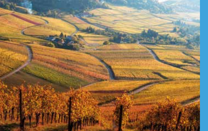
Oben: Toskana-Stimmung in den Weinbergen des Rems-Murr-Kreises.