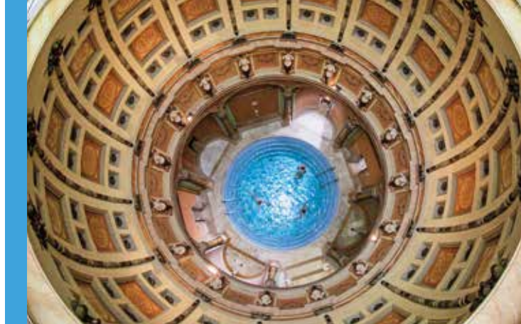
Oben: Römisch inspirierte Kuppel im Friedrichsbad.

Bühnenshows sorgen für grandiose Unterhaltung und über 100 Fahrattraktionen bieten jede Menge Nervenkitzel . Darunter der »blue fire Megacoaster«, »Fjord Rafting« auf dem »skandinavischen Wildbach« und der »Silver Star« – eine der größten Achterbahnen Europas. Abenteuerspielplätze und Märchenwelt bringen Kinderaugen zum Leuchten und die Indoor-Wasserwelt »Rulantica« mit 25 Wasserattraktionen ist ein Badespaß für Groß und Klein. Wechselnde Höhepunkte machen den Park zu einem unvergesslichen Erlebnis!