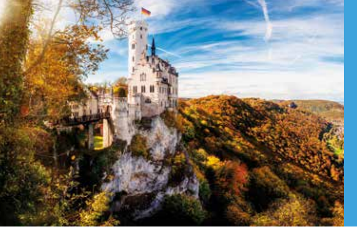
Oben: Schloss Lichtenstein verströmt erhabene Ritterromantik.