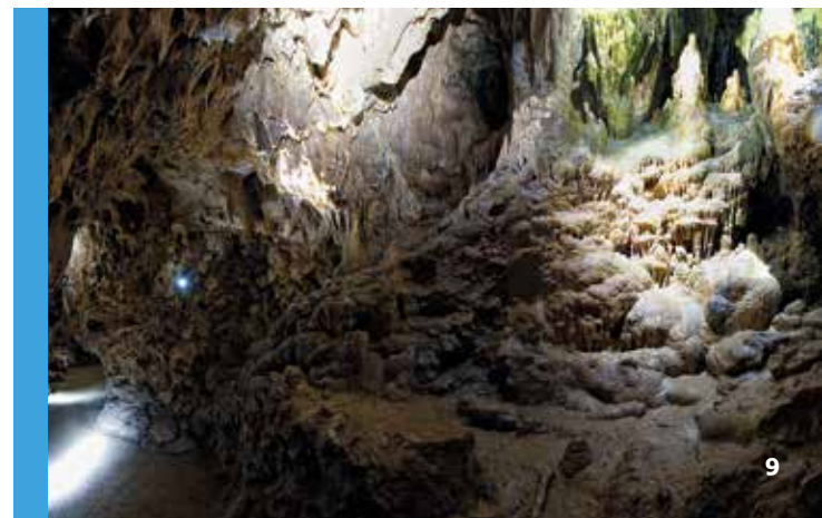
Unten: Bizarre Tropfsteingeilde in der imposanten Charlottenhöhle.

Magisch beleuchtet, lässt sich die geheimnisvoll glitzernde Tropfsteinwelt auf einer einstündigen Führung erkunden. Ein Zeitreisepfad zum Höhleneingang macht die Urzeit, in der hier eiszeitliche Tiere wie Höhlenbären lebten, wieder lebendig. Das Erlebnismuseum HöhlenSchauLand und das Informationszentrum HöhlenHaus sowie ein großer Wasser- und Abenteuer-spielplatz am Fuße der Höhle ergänzen die spannende Zeitreise.