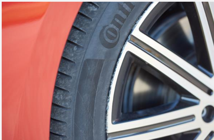
Die Felge nach dem Ausweichtest

Beim Ausweichtest gab es ein Überraschung: Zwar kam der Testwagen trotz der starken Seitenneigung sicher und ohne Kippgefahr bei ziemlich hohem Tempo durch den Parcours, hinterher zeigte sich aber anhand eindeutiger Spuren, dass man mit der vorderen Felge Kontakt zur Fahrbahn hatte. Die Reifen in der optionalen Dimension 245/45 R19 hat es beim Ausweichvorgang so weit „von der Felge gezogen“, dass die Felgenkante auf den Asphalt aufschlug. Druckverlust oder andere Folgeschäden traten aber nicht auf.