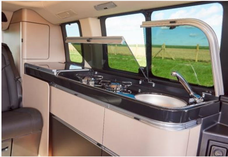
Die Küche ist praktikabel, es fehlt aber an Ablagemöglichkeiten

Der Küchenblock bietet eine Kochstelle mit zwei Flammen mit Piezozünder und ein Rundspülbecken mit 25 Zentimetern Durchmesser, das 13 Zentimeter tief ist. Ablagen sind nicht allzu viele vorhanden, man muss sich mit dem Dinettentisch behelfen oder die geschlossenen Klappen von Kühlschrank, Kochstelle und Spülbecken nutzen: Man muss sich organisieren beim Kochen. Zur Illumination der Küche steht eine zentrale Leuchte über dem Küchenblock zur Verfügung, man wünscht sich mitunter eine gezieltere Lichtquelle. Der von oben zu-