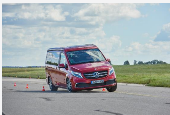
Der Mercedes Marco Polo beim Ausweichtest