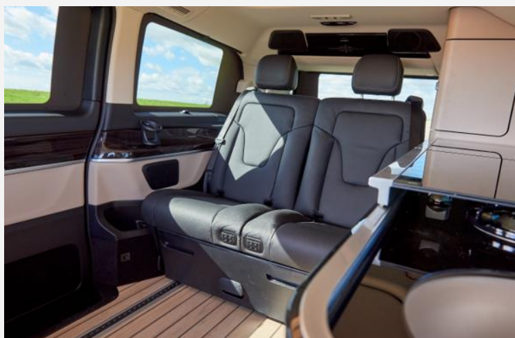
Auf dieser Rücksitzbank reist man sehr komfortabel