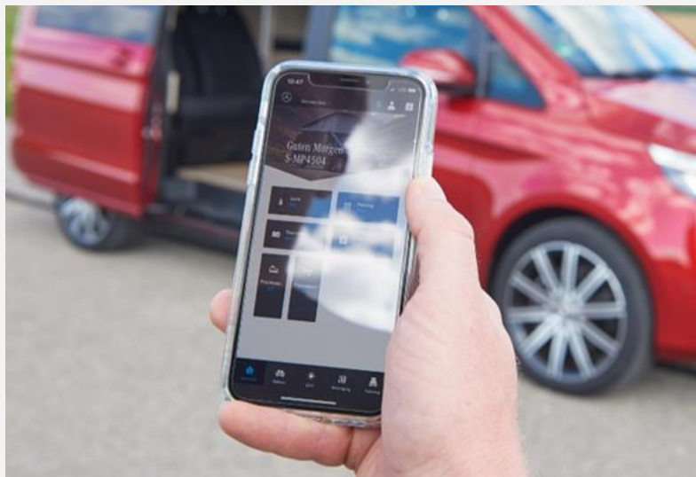
Das MBAC-System kann auch per App gesteuert werden

Mercedes hat eine Neuerung in seinem Campingfahrzeug eingeführt, die auch Campingfahrzeugherstellern zur Verfügung steht, die auf Mercedes-Basis Fahrzeuge bauen: Angelehnt an das aktuelle Pkw-Infotainmentsystem namens MBUX (Mercedes-Benz User Experience) bündelt MBAC (Mercedes-Benz Advanced Control) alle Campingfunktionen in einem Menü. Dieses kann man im Marco Polo entweder über den großen Touchscreen im Armaturenbrett aufrufen oder die entsprechende App auf dem Smartphone öffnen. So kann man auch von der Rückbank aus oder neben dem Fahrzeug Einstellungen vornehmen beziehungsweise Füllwasserstände abrufen oder etwa die Kühlbox steuern. Die App verbindet sich per Bluetooth mit dem Fahrzeug – man muss also schon in der Nähe des Marco Polo sein. Vom Tagesausflug aus kann man den Innenraum des Mercedes daher nicht spontan ferngesteuert vorheizen.