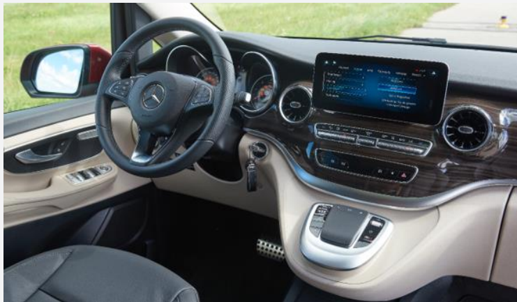
Im wertig anmutenden Cockpit findet man sich schnell zurecht

Der Marco Polo hat nun auch das MBUX-Infotainmentsystem verbaut, allerdings angenehmerweise ohne die Touchflächen am Lenkrad, die andere Mercedes-Modelle tragen. Diese sind merklich schlechter zu bedienen als die Tasten am Lenkrad des Marco Polo. Die Hauptmenüpunkte des ansonsten per Touchdisplay oder Touchpad zu bedienenden Infotainmentsystems sind klugerweise auch per haptischer Tasten am Armaturenbrett zu erreichen. Auch ansonsten gibt sich der Campervan keine wirkliche