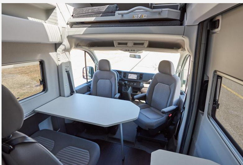
Die Dinette ist zu viert gut nutzbar, wenn auch der Tisch noch etwas größer sein könnte

Steht der Tisch aber, kommt man von allen vier komfortablen Sitzplätzen gut ran – etwas größer könnte die Tischplatte aber noch sein.