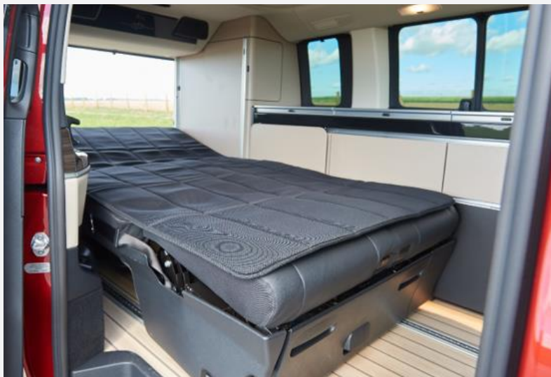
Die Rückbank legt sich per Knopfdruck um

der der Küchenzeile behelfen. Nettes Gimmick: Man kann die Ablage im Kofferraum und damit das Kopfende in mehreren Stufen anwinkeln, so liest es sich angenehmer und manch einer schläft mit leicht angewinkeltem Oberkörper auch besser.