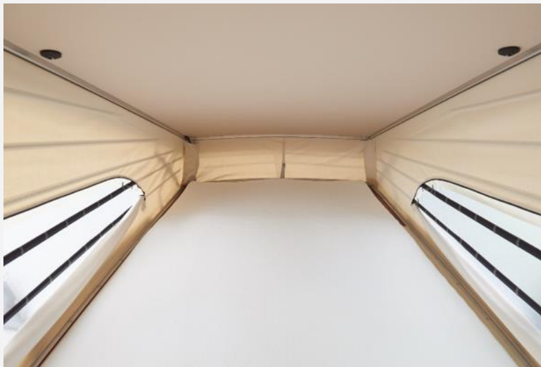
Auch im Fußbereich steht genügend Raum zur Verfügung

zwei Schwanenhalsleuchten und eine USB-Ladebuchse. Das Netz zur Absturzsicherung ist einfach zu montieren und hält Kinder sicher zurück.