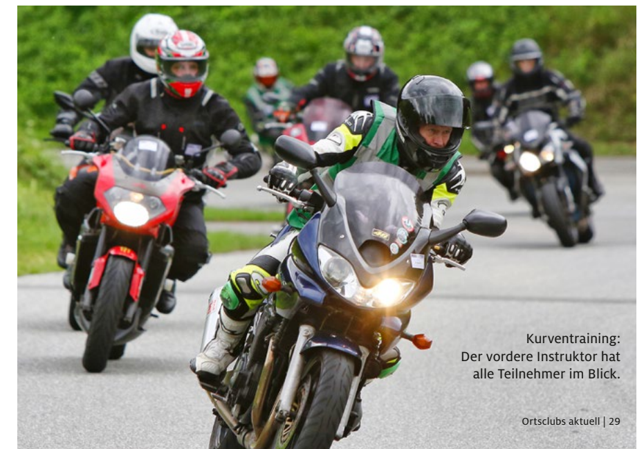
Kurventraining: Der vordere Instruktor hat alle Teilnehmer im Blick.

Der Asphalt des Heidberggrings ist in die Jahre gekommen, so dass eine neue Deckschicht notwendig ist. Die ersten Angebote liegen bereits vor, angestrebt wird eine neue Asphaltdecke zur Saison 2023.