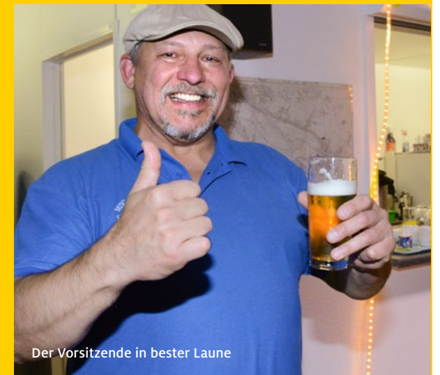
Der Vorsitzende in bester Laune

Auch gebäudetechnisch wurde und wird Hand angelegt, Bistro und Büro sind neu gestrichen und Büromöbel gabs geschenkt. Auch in den Containern wurde aufgeräumt und entrümpelt. Die Betongaragen werden zu einer Vereins-Motorradwerkstatt umgenutzt und eingerichtet.