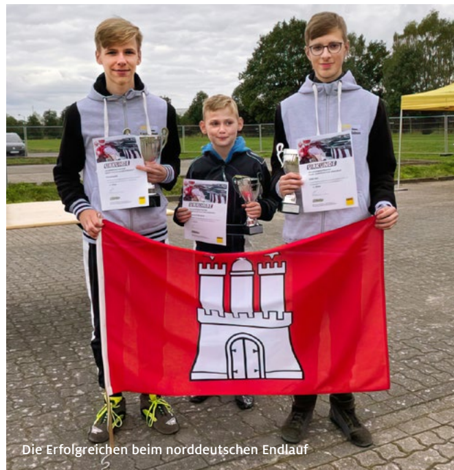
Die Erfolgreichen beim norddeutschen Endlauf