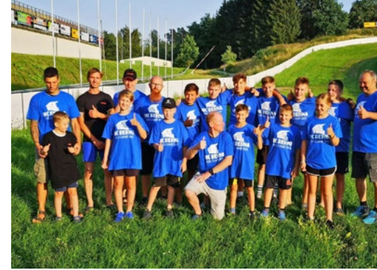
Jugendgruppe vom MC Rehna