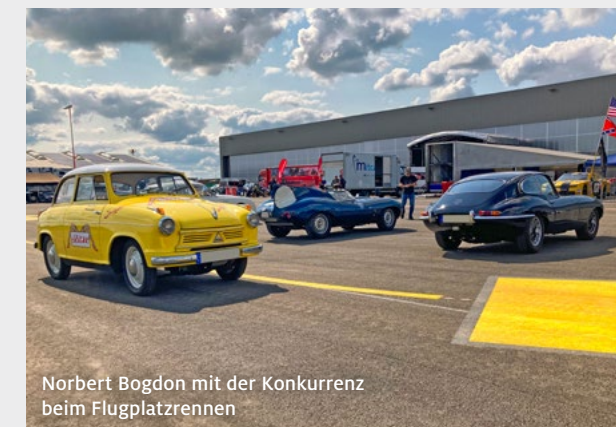
Norbert Bogdon mit der Konkurrenz beim Flugplatzrennen

den furchtlosen Lloyd-Piloten zum Duell herausgefordert, mit einem VW Käfer 1200. Fünf Wettbewerbe stehen an: Nordschleife, eine Rallye, ein Sprint-Rennen, Slalom und zu guter Letzt werden Bogdon und Loch ihre Autos auf Zeit zehn Meter weit schieben.