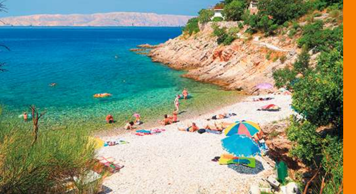
Oben: Sonnenanbeter am strahlend weißen Strand von Senj. Unten: Eindrucksvolle Kette schroffer Felsgipfel im Velebit-Gebirge.

die sie von ihren Reisen mitbrachten. Noch heute sorgt diese Pflanzenpracht in der Bucht für Anblicke wie aus dem Bilderbuch. Vom einstigen Wohlstand der Kapitänsfamilien zeugen auch die reich mit Votivgaben geschmückte Kirche Sv. Antun sowie die repräsentativen Gräber auf dem Gottesacker.