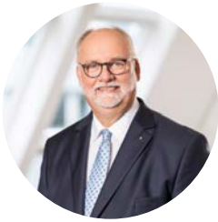
Gerhard Hillebrand ADAC Verkehrspräsident

Eltern wollen nur das Beste für ihre Kinder – und bringen sie deshalb oft mit dem Auto zur Schule. Gehalten wird meist überall dort, wo sich Platz findet, also auch an Bushaltestellen, im Haltverbot oder in zweiter Reihe. Das ist für alle Kinder gefährlich – die eigenen eingeschlossen.