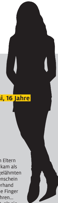
Sissi, 16 Jahre