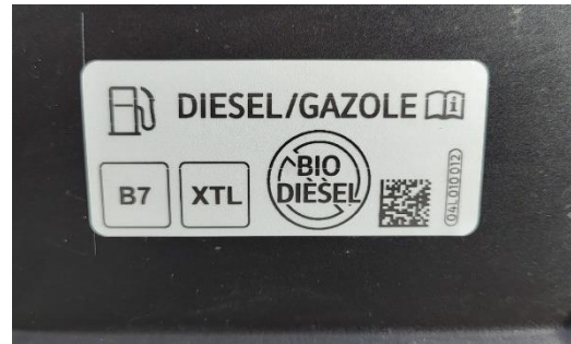
Abbildung 1: Beispiel Hinweis in Tankdeckel

In Kürze darf ein neuer Dieselkraftstoff an Tankstellen in Deutschland angeboten werden: Paraffinischer Diesel (Kennzeichnung: XTL). Der größte Unterschied für den Kunden besteht darin, dass Paraffinischer Diesel nur dann getankt werden darf, wenn der Hersteller eine spezielle Freigabe für die Verwendung erteilt hat, genau wie es bei der Verwendung von Super E10 der Fall ist.