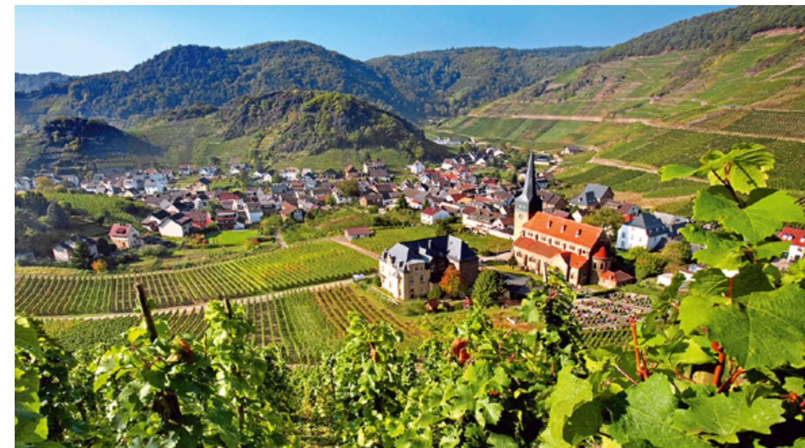
Genussfahrt durchs Ahrtal: Tagsüber durch die idyllische Landschaft cruisen, abends bei einem Glas Wein den Tag ausklingen lassen, wie hier in Mayschob