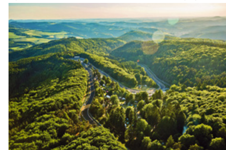
Legendär: Einmal mit dem Motorrad die Nordschleife des Nürburgrings fahren

Wichtige Infonummern • ADAC Auslandsnotruf: +49 89 22 22 22 • Polizei/Unfallrettung: 112 • Weitere ADAC Servicenummern sind auf der Rückseite Ihrer ADAC Mitgliedskarte