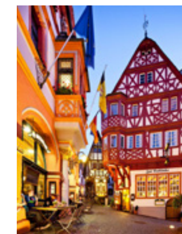
Zeitreise ins Mittelalter: der Marktplatz in Berncastel-Kues

Mit viel Sorgfalt haben wir diese Tourenvorschläge in der schönsten Region des Saarlandes, Luxemburgs und der Eifel-Ardennen zusammengestellt. Im Maßstab 1:300 000 führen die Routenvorschläge den interessierten Genussschwärmer durch ein wahres Tourenparadies, ganz egal ob man mit Motorrad, Pkw, Cabrio oder Oldtimer unterwegs ist. Im Mittelpunkt stehen der pure Fahrgenuss und die Lust am Entdecken. Einen aktuellen Überblick zu den verschiedenen ADAC Tourenkarten erhalten Sie im Internet unter adac.de/reise-freizeit/motorrad . Unter maps.adac.de kommen Sie zu einem individuellen Routenplaner. Auf unseren Themenseiten für Motorrad- und Oldtimerfahrer geben wir Ihnen umfangreiche Tipps und Ratschläge zum jeweiligen Hobby ( www.adac.de/motorrad bzw. adac.de/oldtimer ).