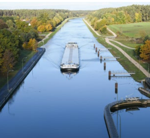
Das Binnenschiff fährt aus Richtung Nürnberg in die Schleuse Eckersmühlen ein

Ziel einer Schleuse ist der Ausgleich des auf Wasserstraßen bestehenden Wasserstands. Je nachdem, ob ein Schiff bergauf oder bergab fahren möchte, wird der Wasserstand in der Schleuse entweder angehoben oder verringert. Im ersten Schritt fährt das Schiff in die Kammer ein, die mithilfe zweier Tore geschlossen wird. Anschließend wird entweder Wasser eingeleitet oder abgelassen. Der Vorgang erfolgt dabei nicht über Pumpen, sondern über den natürlichen Höhenunterschied. Bei der Schleuse Eckersmühlen handelt es sich um eine sogenannte Sparschleuse, die über drei Sparbecken einen Großteil des Schleusenwassers speichert und so den Wasserverbrauch minimiert.