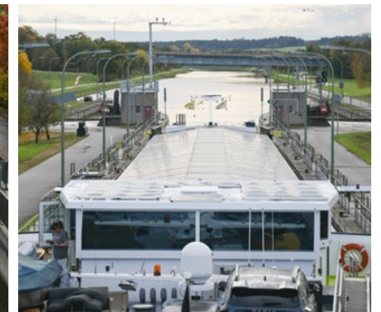
Nach rund 25 Minuten bzw. Höhenmetern ist das Schiff bereit für die Weiterfahrt