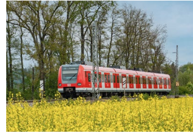
Ländliche Strecken sorgen für Abwechslung Hier durchquert ein Fahrzeug der meistgenutzten Baureihe ET 423 das Münchner Umland