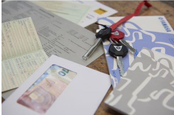
Nach der Kaufentscheidung sollte in Ruhe der „Papierkram“ erledigt werden.

( https://assets.adac.de/image/upload/v1608194672/ADAC-eV/KOR/Text/PDF/kaufvertrag-motorrad_arhphw.pdf )