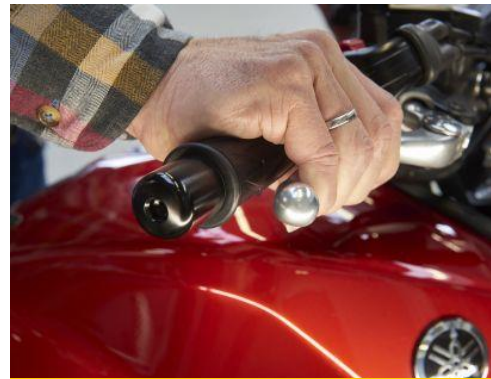
Der Bremsgriff darf sich nicht voll durchziehen lassen.

Wurden Teile der Bremse (z.B. Stahlflex-Bremsleitungen) um- oder nachgerüstet, überprüfen Sie die Eintragungen im Brief bzw. die KBA- oder ABE-Nummer.