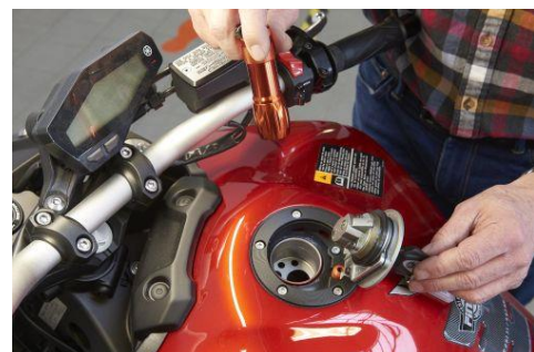
Rost am und im Tank ist nur bei alten Maschinen zu erwarten, wenn sie überwiegend unter freiem Himmel standen.