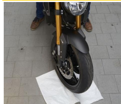
Eine Folie unter dem Vorderrad reduziert die Lenkkräfte. Defekte am Lenkkopflager lassen sich so leichter „erfühlen“.