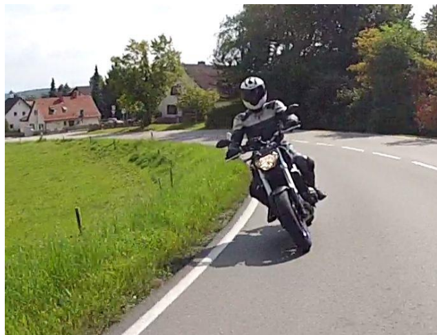
Je abwechslungsreicher die Probefahrt, umso leichter wird die Kaufentscheidung.

Harte mechanische Geräusche sind ungewöhnlich und nur bei wenigen großen 1-Zylindermotoren „normal“. Auch sehr laute Pfeif- und Wimmergeräusche sind ungewöhnlich. Prüfen Sie diesen Punkt nochmals später, wenn der Motor warm ist.