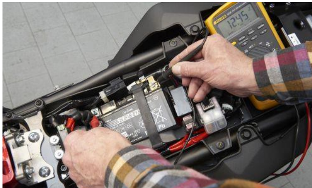
Erst unter Last zeigt die Batterie die inneren Werte.