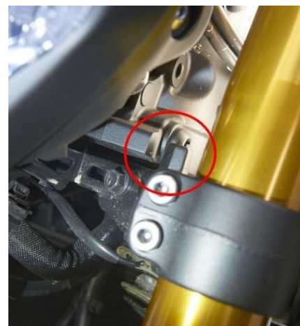
Der Lenkeranschlag darf nicht gebrochen oder verformt sein.

Eine weitere Methode zur Prüfung des Lenkkopflagers und der Telegabel: Drücken Sie das Vorderrad gegen eine Wand, und lassen Sie die Telegabel stark ein- und ausfedern. Knackende Geräusche im Lenkkopf oder in der Gabel weisen auf Spiel und Verschleiß hin. (s.a. Probefahrt, Fahrwerk)