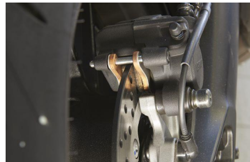
Die Nagelprobe an den Bremsscheiben.