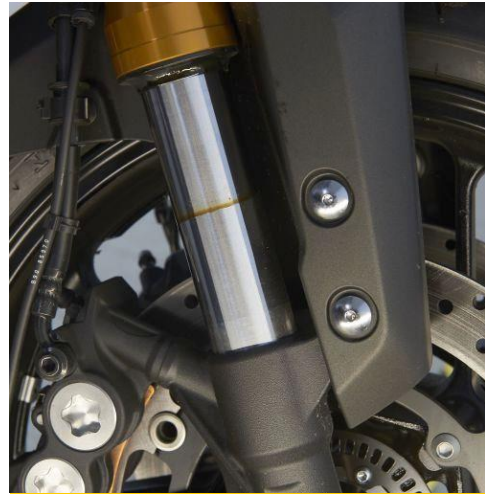
Ein Ölfilm auf dem Gleitrohr deutet auf defekte Simmerringe hin.

In Einzelfällen werden die Gabelholme in den Gabelbrücken verschoben, meist um die Fahrzeugfront abzusenken und damit die Sitzhöhe zu reduzieren. Diese Einstellung sollte wieder auf die originale Position korrigiert werden.