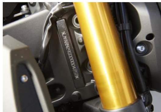
Fahrgestellnummer: Gehören Maschine und Papiere zusammen.

Zum Verkauf anstehende Motorräder sind meist auf Hochglanz poliert. Der Käufer sollte sich bei aller Schönheit hiervon nicht blenden lassen. Auf der anderen Seite werden auch immer wieder „Standuhren“ offeriert, bei denen besondere Prüfungen einzelner Komponenten sinnvoll werden. Wenn der erste Eindruck wenig überzeugt, kann auf die Detailprüfung meist verzichtet werden.