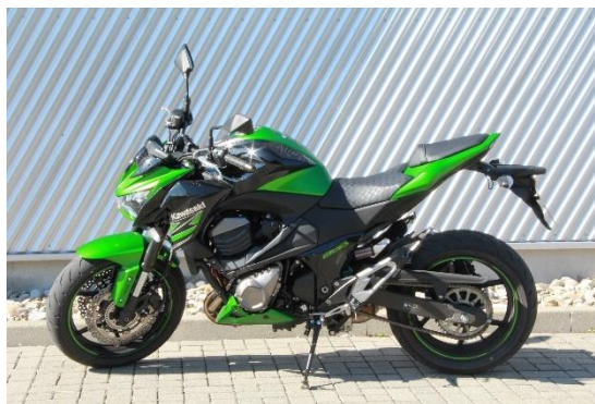
Auch ein Original kann schön sein. Nicht jeder Umbau gefällt.

Besondere Vorsicht ist geboten, wenn Teile des Rahmens und/oder der Schwinge nachträglich bearbeitet wurden. Vereinzelt werden Flächen und Schweißnähte des Rahmens abgeschliffen und/oder poliert. Diese Veränderungen lassen vielfach die Betriebserlaubnis erlöschen und können deswegen spätestens bei der nächsten Hauptuntersuchung Probleme bereiten. Also, besser Finger weg!