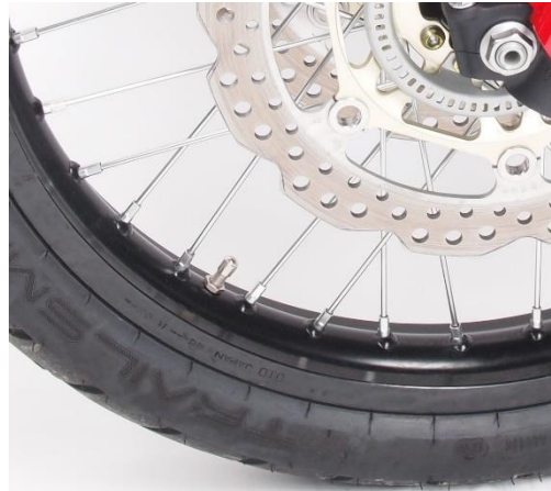
Drahtspeichen genau prüfen. Mit lockeren, fehlende o. gebrochene Speichen sollte nicht gefahren werden.

Die korrekten Reifendimensionen finden Sie in der Zulassungsbescheinigung Teil 1 (Fahrzeugschein) in den Zeilen 15.1. und 15.2 oder im CoC (EU-Übereinstimmungsbescheinigung) unter dem Punkt 32. Ein Hinweis auf eine Reifenfabrikatsbindung wird im Feld 22 der Fahrzeugpapiere eingetragen. Die werksseitigen Reifenfreigaben stehen meist auch in der Bedienungsanleitung. Wenn eine Reifenbindung vorgesehen ist und nicht die werksseitig freigegebenen Reifenmo-