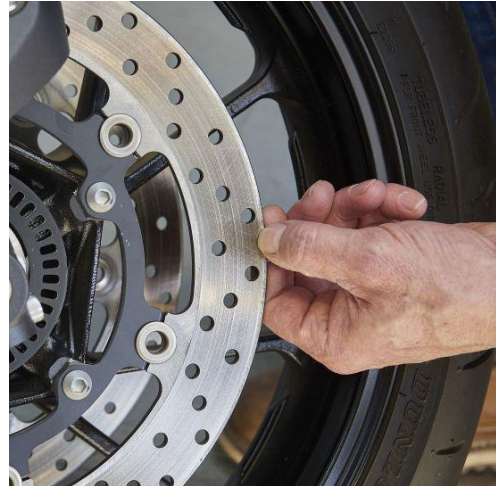
Die Nagelprobe an den Bremsscheiben.

An Trommelbremsen gibt ein Verschleißanzeiger Auskunft über die Belagstärke. Befragen Sie den Verkäufer, ob die Bremsbeläge freigegebene Originalteile des Herstellers oder günstigere Ersatzteile aus dem Zubehör sind. Aussagen des Verkäufers im Zweifelsfall im Kaufvertrag notieren.