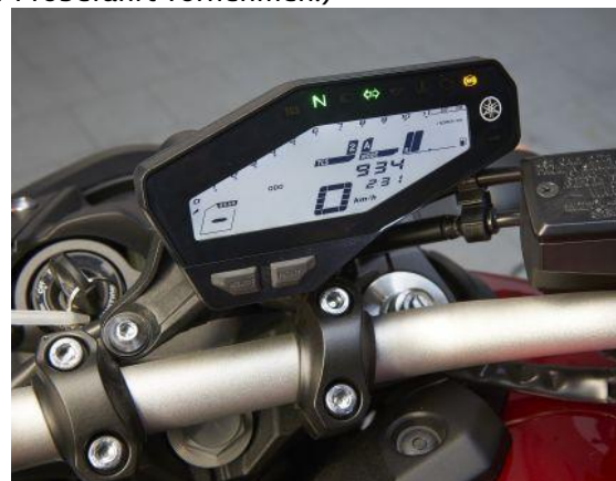
Nur selten haben moderne Displays Fehler, der Ersatz kann teuer werden.