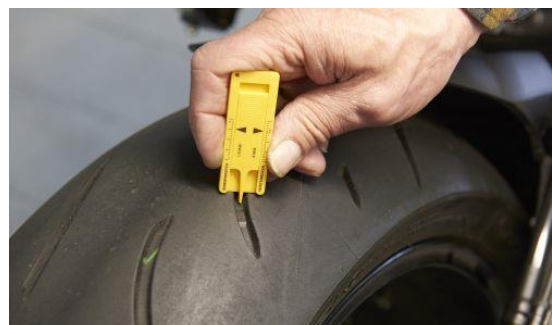
Je mehr, umso besser. Bei den Preisverhandlungen ein Thema: Profiltiefen.